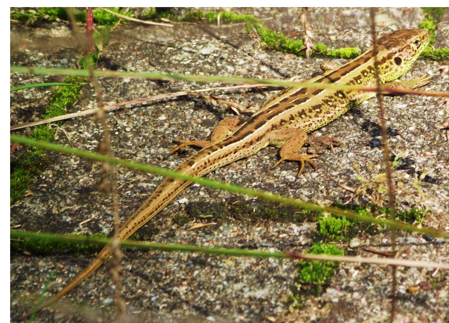
Abbildung 2: Zauneidechse ( Lacerta agilis ), die bei der Artenerfassung im Hohenheimer Park gefunden wurde. Insgesamt konnten 13 Zauneidechsen im Hohenheimer Park gesichtet werden. In den Biotopen südlich von Kemnat konnte nur ein Tier nachgewiesen werden, während im Naturschutzgebiet Eichenhain mehrere Zauneidechsen gesichtet wurden und zusätzlich an mehreren Stellen „Eidechsenrascheln“ vernommen werden konnte. Schlangen konnten bei den Begehungen nicht nachgewiesen werden.